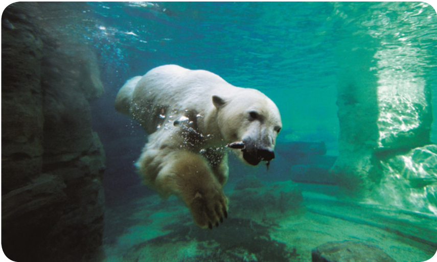
@ Zoo am Meer – Eisbär tauchend

Die Hin- und Rückfahrt werden wir mit dem Zug erleben.