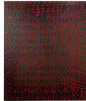
Simon Halfmeyer, ### red/green mesh, 2024