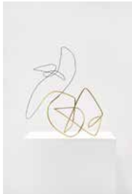
Birte Bosse, Space Drawing, 2020