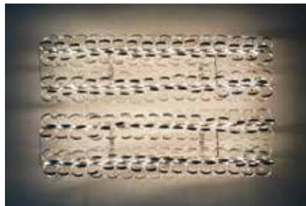
Emil Walde, Gatekeeper, 2024