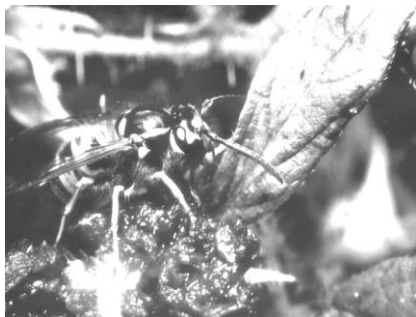
Eine süße Beere: Da kann die Deutsche Wespe nicht widerstehen!

Lediglich zwei Arten werden auf ihrer Suche nach Süßigkeiten zudringlich: die Deutsche und die Gemeine Wespe. Sie sind es, die in der Konditorei den Bienenstich belagern, unseren Kaffeetisch umschwärmen und an der Cola nippen wollen. Alle anderen Wespenarten lassen solche Schleckereien kalt.